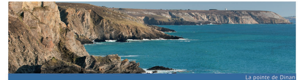
La pointe de Dinan